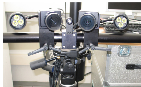
Bild 2: Kamerasystem zur optischen Deformationsmessung (gom ARAMIS/PONTOS 5M).

Nutzen Sie diese berührungslose Messmethode, um einen vertieften Einblick in die Strukturmechanik Ihres Bauteils zu erhalten oder Simulationsmodelle zu validieren.