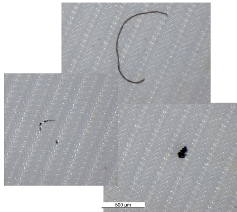
Beispiele von Partikeln auf einem 5 µm Siebwebefilter. Metallischer Partikel (links), nichtmetallischer Partikel (rechts) und Faser (oben)

Das Filteranalysesystem dient dazu, die auf dem Filter befindlichen Partikel automatisch auszuzählen, zu vermessen und nach ihrer Art (metallisch, nichtmetallisch, Fasern) zu typisieren.