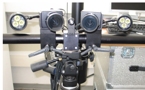
Bild 2: Kamerasystem zur optischen Deformationsmessung (gom ARAMIS/PONTOS 2M).

Nutzen Sie diese berührungslose Messmethode, um einen vertieften Einblick in die Strukturmechanik Ihres Bauteils zu erhalten oder Simulationsmodelle zu validieren.