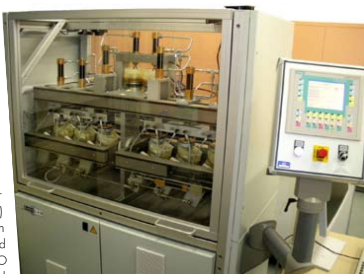
Abbildung 1: Servohydraulischer 6-Stationen Hüft- und Wirbelsäulensimulator.

von künstlichen Hüftgelenken und Bandscheibenimplantaten eingesetzt werden. Im Simulator sind die Hüftimplantate in den sechs bewegten Stationen analog zur menschlichen Hüfte angeordnet. Zusätzlich befinden sich auf dem Simulator zwei Quellproben, welche zwar die gleiche Last erfahren, aber nicht bewegt werden. Getestet wird bei 37°C in einer proteinhaltigen Lösung basierend auf Rinderserum, ähnlich der Synovialflüssigkeit im Hüftgelenk. Ein Test dauert üblicherweise 5 Mio. Zyklen, was einer Beanspruchung